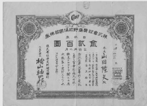
広島野球倶楽部株券