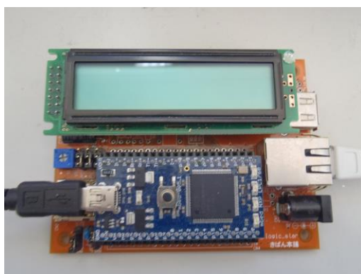
ネットワーク対応 組み込みマイコン